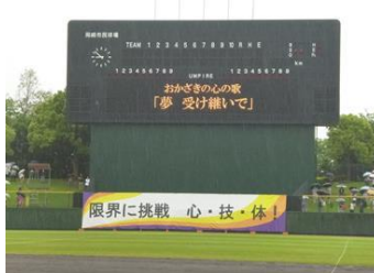
■5月16日 第59回岡崎中学校総合体育大会に出席する。