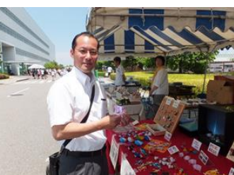
■5月31日 善明わくわくホリデーに出席する。