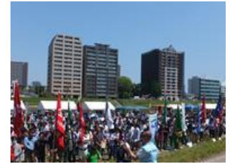
■5月10日 連合愛知三河中地協メーデーに参加する。