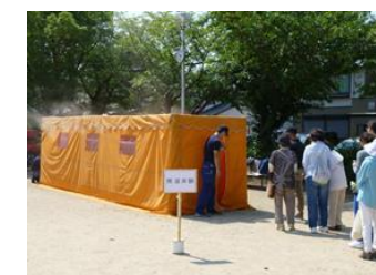
■6月13日 地域防災訓練に出席する。