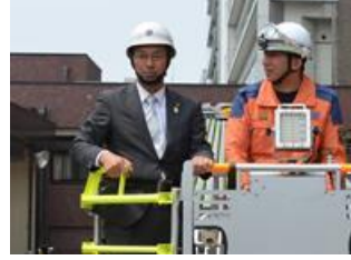
■4月28日 環境教育委員会にて、救急業務の高度化を確認。52mlはしご車に乗車する。