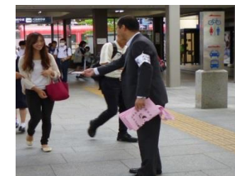
■6月11日 2015年全国一斉「働く女性のための労働相談ダイヤル」の街頭活動に参加する。