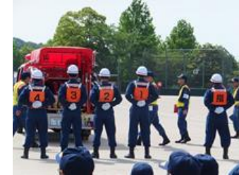
■5月17日 岡崎市消防団消防操法大会に出席する。