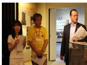
■6月21日 知って納得!「岡崎地区見学会」に参加する。