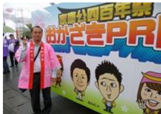
■4月5日 家康公四百年祭のため家康行列パレードに、議員団として参加する。