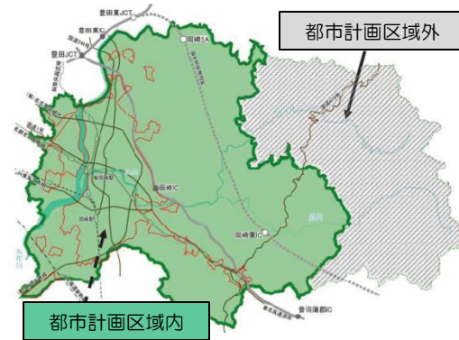
◇都市計画の指定範囲

A:平成18年1月1日に額田町と合併した折に、一部の区域は都市計画マスタープランに編入し、土地利用の誘導施策がされている。しかし、その他の地域(グレー斜線部)は開発許可の手続きを必要としないため、太陽光発電施設や資材置き場など無秩序に利用される恐れがある。その為、土地利用の方針を示し、自然環境や水環境を保全及び土地利用の実施個所の誘導等を行うため制定する。