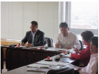
■5月13日 歴史まちづくり検討特別委員会にて視察する(金沢市での様子)。