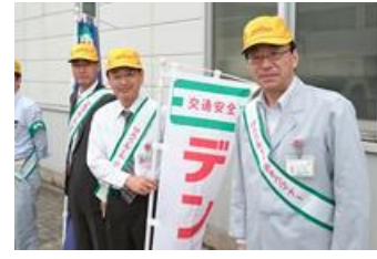
■4月28日 デンソー西尾製作所北門にて、連休前セーフティーコールを実施する。