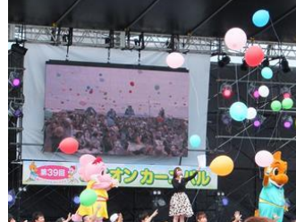
■5月24日 ユニオンカーニバルラグーナ蒲郡に参加する。