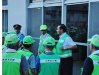
■8月6日 地域防犯夜間パトロールに参加する。