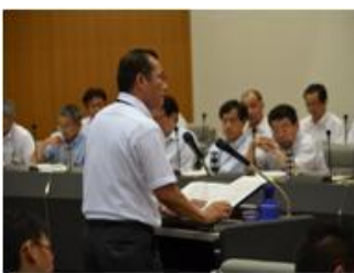
■9月4日 9月定例会にて一般質問に登壇する。