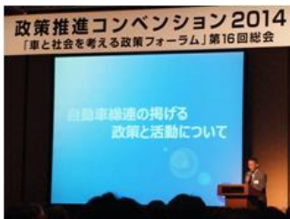
■7月22日 自動車総連「政策推進コンベンション2014」に参加する。