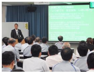
■7月9日 デンソー幸田製作所にて、議員報告会を実施する。