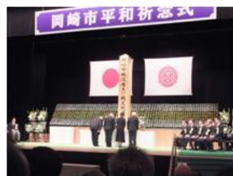
■7月19日 岡崎市平和祈念式に参加する。