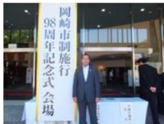
■7月1日 岡崎市制施行98周年記念式典に参加する。