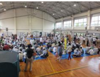
■8月31日 岡崎市地域総合防災訓練に参加する。