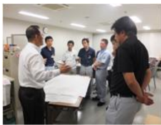
■7月7日 デンソー安城製作所にて、ふれあいトークを開催する。