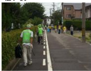
■8月3日 岡崎市道路ボランティア清掃に参加する。