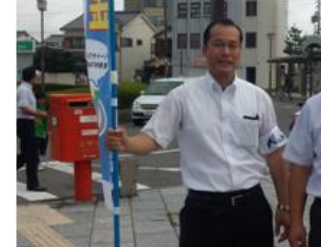
■8月5日 連合愛知三河中地協「最低賃金改定に関する取組みPR」の街頭活動に参加する。