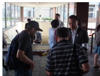
■9月29日 連合愛知三河中地協「秋の交通安全」の街頭活動に参加する。

【お詫びと訂正】7月に発刊した、市政レポートNo.7において第1紙面 学校法人藤田学園などと『大学病院の建設に関する協定』の締結がされるの記載内容で、岡崎市民病院の病床数を750床と記載しましたが、正しくは700床であります。謹んでお詫び申し上げます。