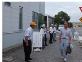
■8月8日 デンソー西尾製作所北門にて、連休前交通安全立哨を行う。