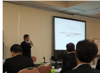
■11月3日 ユタカクラブ議員研修会に参加する。