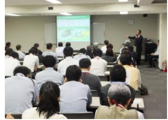
■11月26日 デンソー本社にて議員報告会を開催する。