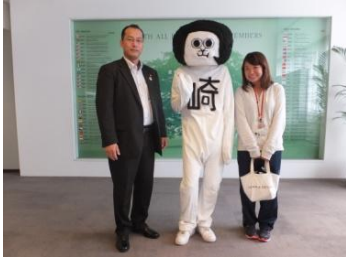
■10月5日 西尾わくわくホリデーに参加する。オカザえもと葵武将隊が来場。