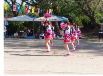
■10月25日 岡崎平和学園運動会に出席する。