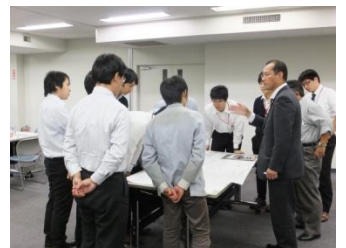
■10月28日 デンソー本社にてふれあいトークを開催する。