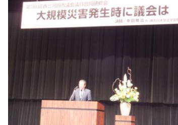
■11月18日 第38回西三河四市議会議員合同研修会に参加する。