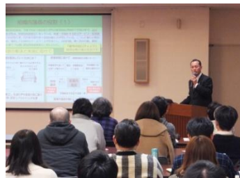
■12月19日 いなべ市民公民館で開催された、デンソー労組春の取り組み研修会に参加する。