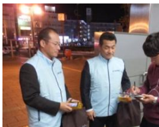
■10月14日 JR岡崎駅西口にて連合中地協の「核兵器廃絶100万署名」に参加する。