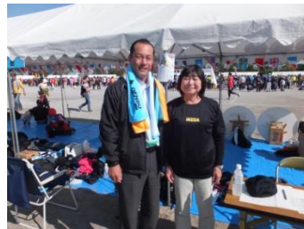
■10月19日 デンソー高棚製作所にて開催の、全社運動会イベントに出席する。