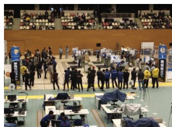
■11月29日 技能オリンピックの開催地（刈谷・岡崎）を訪問する。