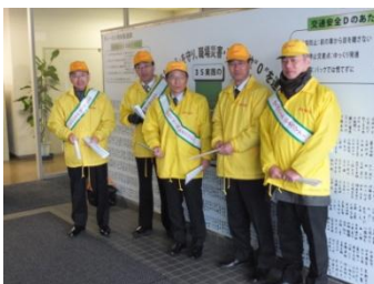
■12月3日 デンソー善明製作所で実施された、役員立哨に参加する。