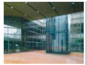
大型エレベーター

文化センターの改修に伴い、マツバホールのバリアフリー化や音響設備の更新、高齢者、障害者の方へ配慮した中庭に大型エレベーターの設置等を要望し実現します！