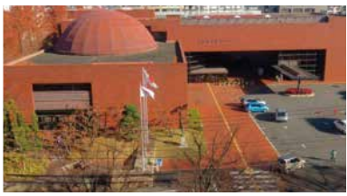
安城市文化センター