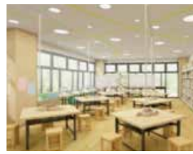
ものづくりスペース